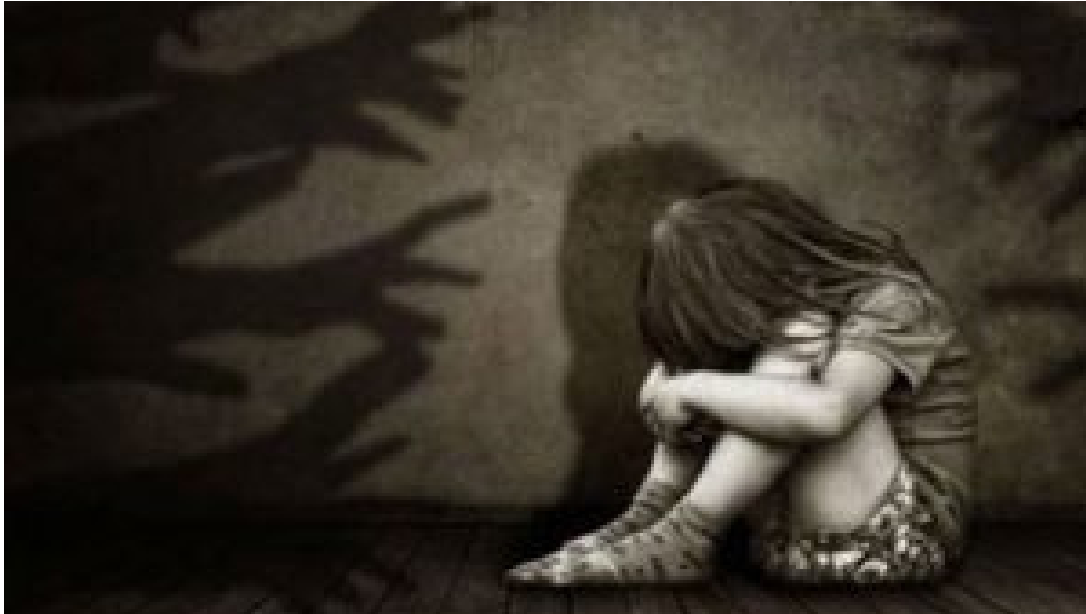
Ilustrasi Kekerasan Seksual.