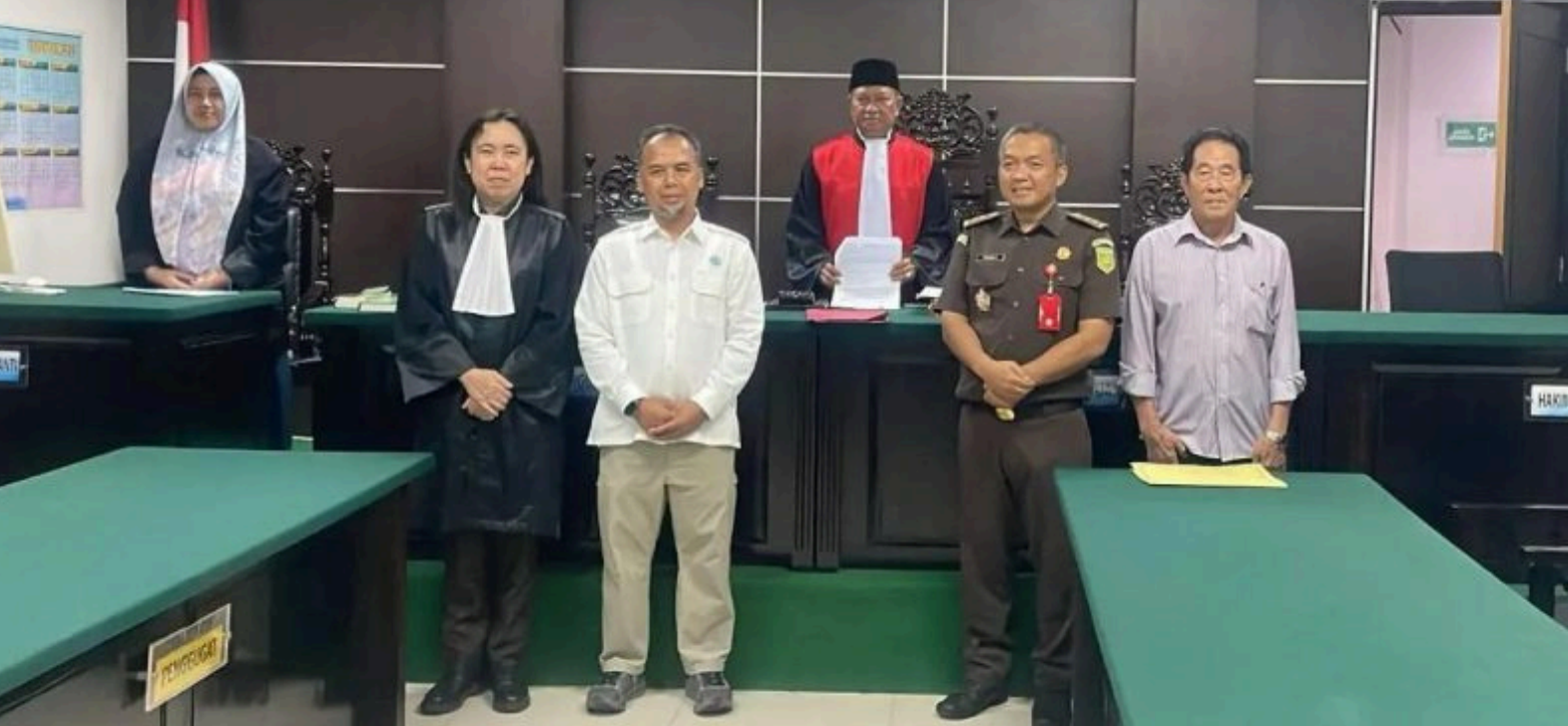
Sidang Pencemaran Lingkungan di PN Serang.