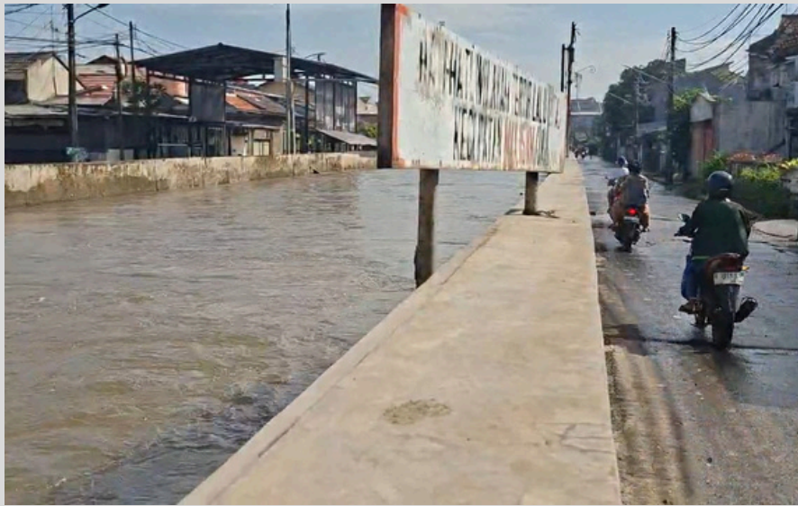
Aliran Kali Ciputat, Pondok Aren. (Dok)

Di kawasan Pondok Aren hingga Ciputat, perubahan itu tidak hanya terlihat di permukaan, tetapi juga terasa di bawah tanah sosial warga: banjir yang kian sering, rumah yang dijual, dan memori tentang sungai yang pernah jernih.