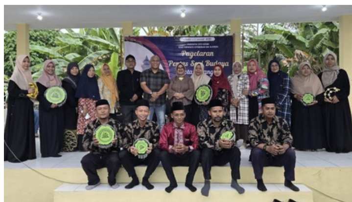
Peresmian TIC Kota Serang

Dari 17 subsektor ekonomi kreatif, lima di antaranya telah menunjukkan pertumbuhan yang melesat. Untuk mendukung ini, sebuah ikon baru bernama 'Royal Baru' tengah disiapkan. Kawasan ini diproyeksikan menjadi episentrum pertumbuhan ekonomi, tempat di mana para kreator lokal menjadi aktor utama, bukan sekadar penonton di rumah sendiri.