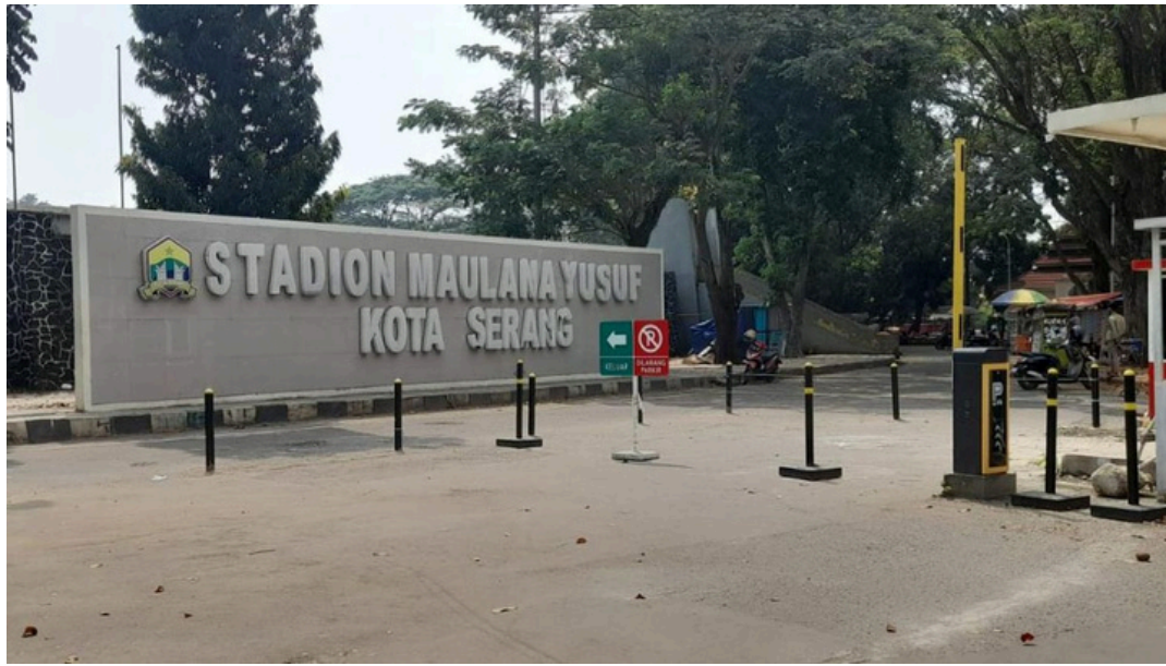
Stadion Maulana Yusuf

Selama bertahun-tahun, deru napas para atlet di lintasan lari kerap tenggelam dalam riuh rendah aktivitas niaga yang tak beraturan. Namun kini, angin perubahan mulai berembus. Pengembalian fungsi gelanggang ini bukan sekadar urusan semen, aspal, atau pagar beton—ia adalah sebuah ikhtiar besar memulangkan jati diri ruang publik demi melahirkan generasi emas dari tanah para jawara.